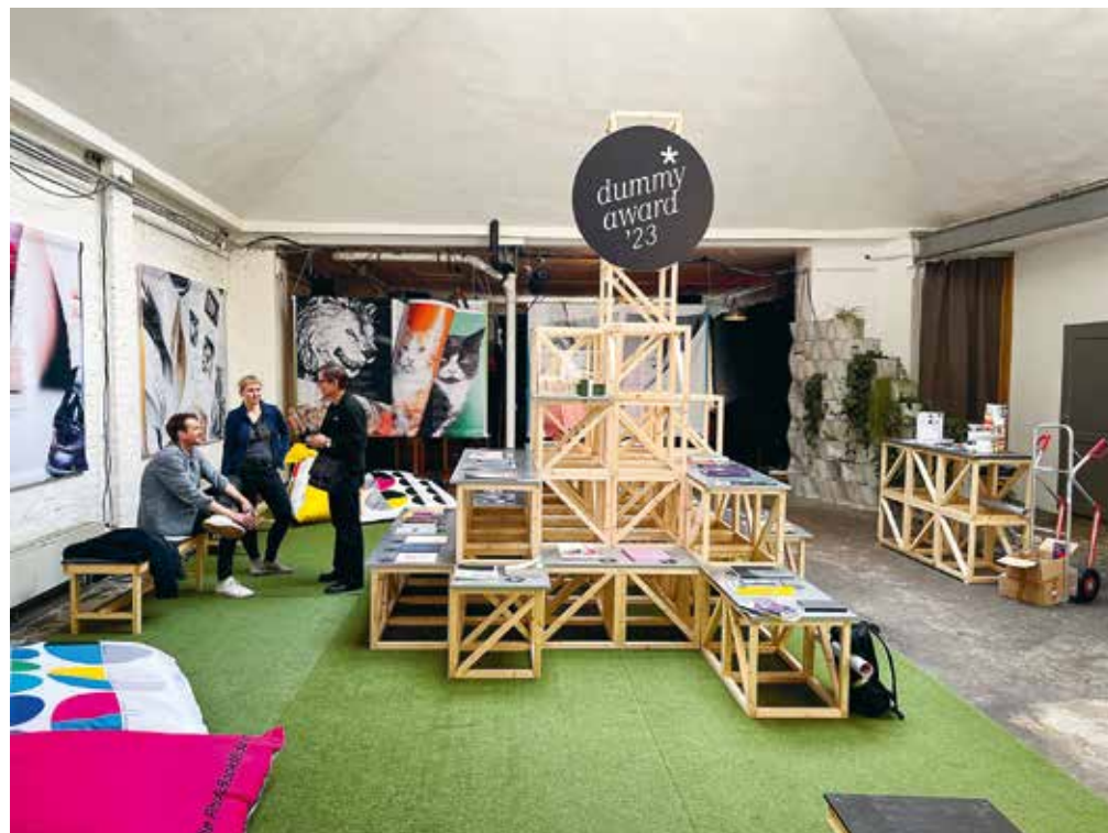
Dummy Award Ausstellung im Exhibition in PhotoBookMuseum in Köln.

eigensinn Publishing (DE), EIKON (AT), Editions du Caïd (BE), Essarter Éditions (FR), Ferdows Faghir (AF/NL), Fotobus Society (DE), Fotoklassen der HGB Leipzig (DE), f/stop Leipzig (DE), Fotohof (AT), Hartmann Books (DE), Homeparkpress (DE), INAPA (DE), Klasse Buchkunst der Burg Giebichenstein (DE), Lotta Bindery - Books (IT), Lzpbooks (US), March and Stone books (ES), Peter Paul Lorenz (DE), Sayo Senoo (FR), Self Publishers United (NL), Stockmans Art Books / HOPPER&FUCHS (BE), Sylvia Mikulik / Ulf Leuteritz (DE), The Angry Bat (SL), Tom Klein (DE), Shushushushu (DE/CN), Uwe Klos (DE), Verlag Kettler (DE), Verlag Marian Arnd (DE), Yogurt Editions (IT).