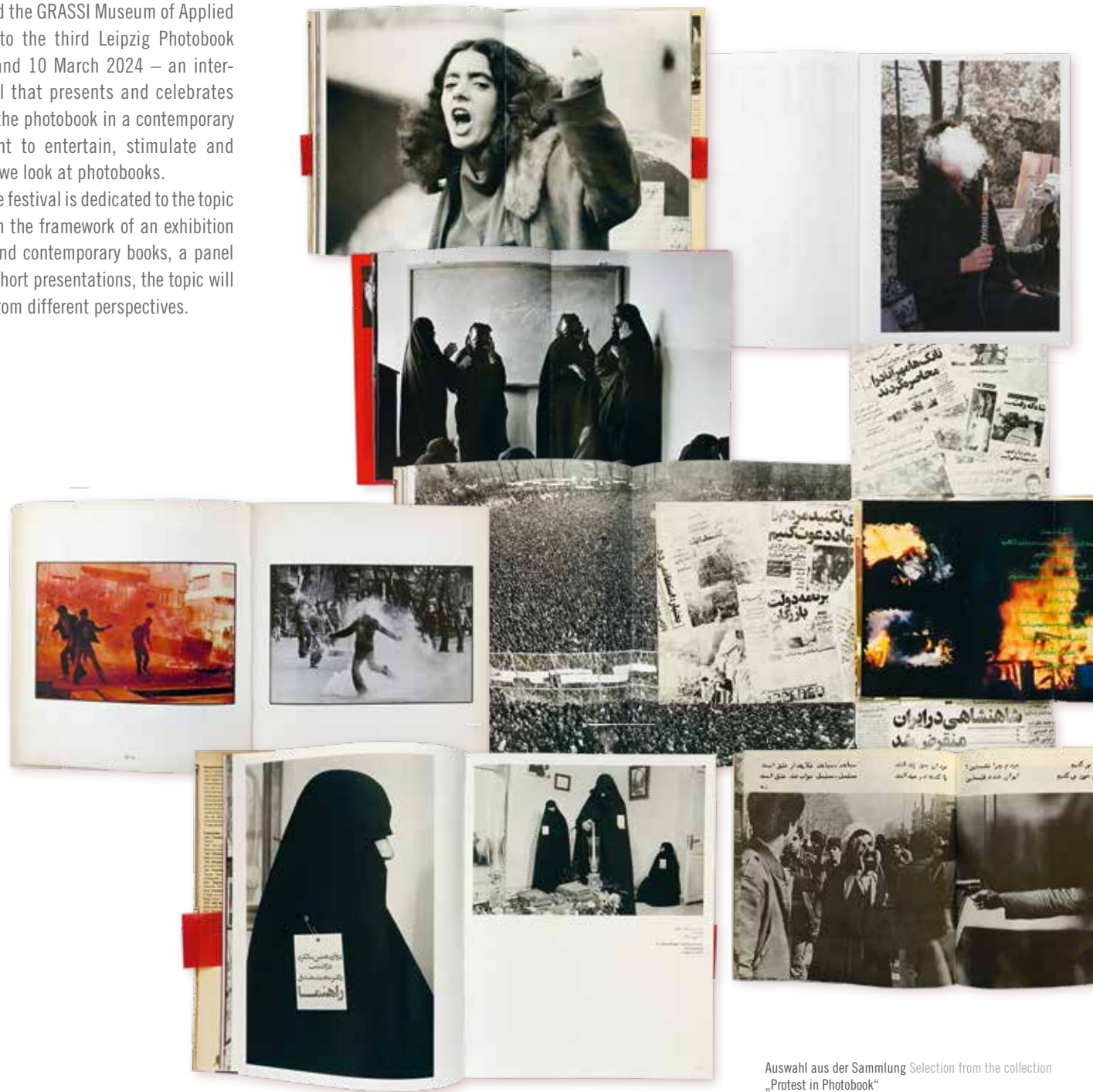
Auswahl aus der Sammlung Selection from the collection „Protest in Photobook“

Luciano Zuccaccia has been interested in photobooks as a collector and researcher for several years and has built up the specialised collection „Protest in Photobook“. We are exhibiting a selection of 25 historical and contemporary photobooks from this collection, which show protest movements in Iran. From rare pamphlets and leaflets to propaganda material and artistic and unique photobooks. Luciano Zuccaccia will be present and available for questions and discussions.