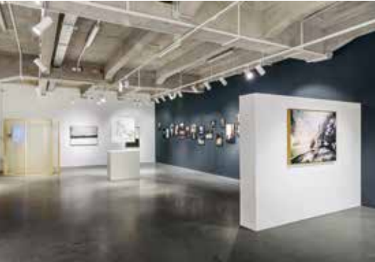
Ausstellung Exhibition „(I) Remember Europe“, Salonul de Proiecte Bukarest, 2023

Datum, Uhrzeit und Dauer: 10.03. von 10:30 - 17.00 Uhr, Ort: GRASSIMUSEUM, Pädagogische Werkstätte, Teilnahmegebühr: 70 €, max. 10 Teilnehmer*innen Date, time and duration: 10.03. from 10:30 - 17.00, Location: GRASSIMUSEUM, Educational workshop, Participation fee: 70 €, max. 10 participants