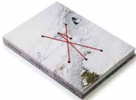
Book „(I) Remember Europe“, Fotohof edition, 2022