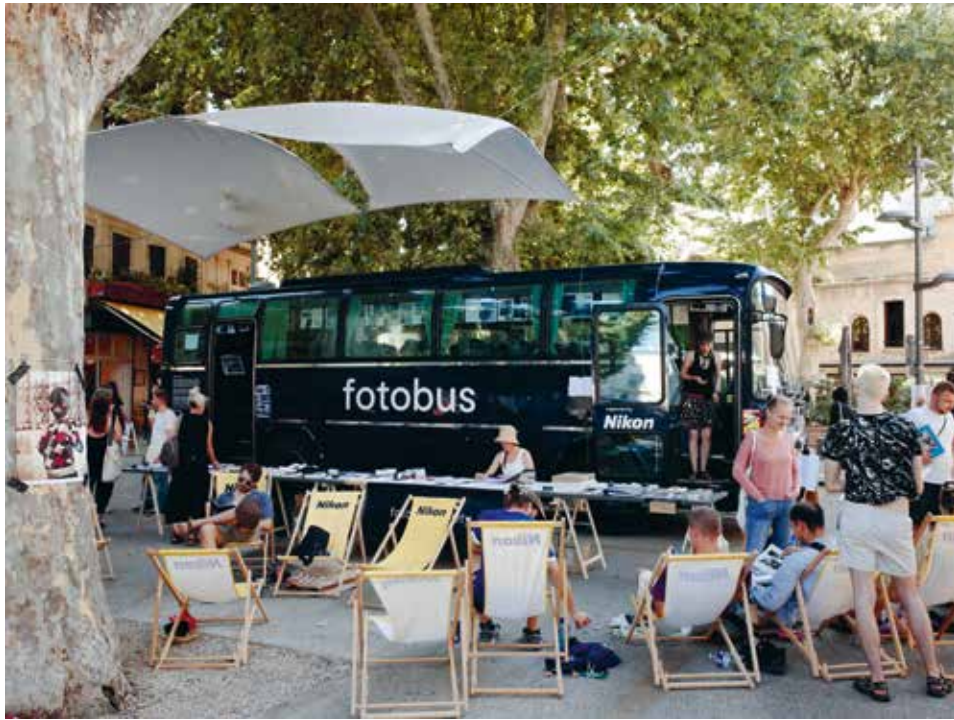
Fotobus Society in Arles

Freitag Friday 08.03., 18:00 – 19:30, Institut Français, Thomaskirchhof 20, 04109 Leipzig