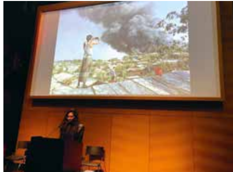
Vorstellung des Rohingyaatographer Magazines aus Bangladesch Presentation of the Rohingyaatographer Magazine from Bangladesh, Leipzig Photobook Festival 2023.