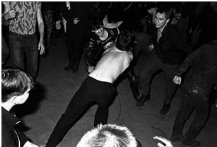
Still aus dem Film Still from „Lange Weile“

The photo film „Lange Weile“ is a montage consisting of 400 b/w photographs taken by Tina Bara between 1983 and 1989 in East Berlin, the GDR and while travelling. The series is composed of photographs taken with friends, documentary photographs of an illegal trip to the Baltic States and forbidden photos from the VEB Buna, photos of rebellious young people, intimate body and portrait pictures, as well as a photographic love story, she comments autobiographically and fragmentarily on the context from which the photographs were taken and tells from today's perspective of the beginning of her artistic development and the role of photography in this process.