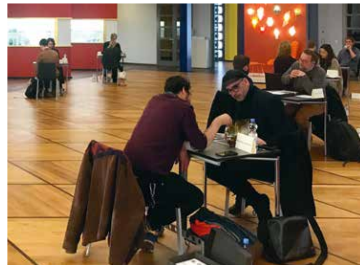
Portfolio Reviews während des Leipzig Photobook Festivals 2023. Portfolio Review during Leipzig Photobook Festival 2023.

As part of the festival, we offer all photographers the opportunity to have their photographic works, series, photobook dummies, etc. reviewed by an international jury of photography and photobook experts, curators, publishers and designers.