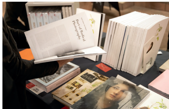
Leipzig Photobook Festival 2022

Aussteller*innen Exhibitors: 2404editions (DE), 89books (IT), African Photo-books, Axel Schneegaß (DE), dienacht Publishing (DE), DITO Publishing (IT), Dutch Independent Art Book Publishers (NL), Editions du Caïd (BE), Fotoszene Leipzig (DE), Fotohof (AT), Iwona Knorr Fotografie (DE), Kehrer Verlag (DE), La Maison de Z (FR), Lecturis Publishers (NL), Lycien-David Csery (DE), KRAUTin Verlag (DE), Kulleraugen-Verlag (DE), Lubok Verlag (DE), Mark Pezinger